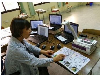
書画カメラを駆使して授業

コロナ感染の混乱で、学校教育の停滞が心配された年度初め、本校では迅速に、e-Learningによるオンライン教育体制を構築。外出制限の続く中、オンラインで始業式、入学式を行いました。アブダビ日本人学校教職員は一致団結して児童生徒に、大切な教育課程の着実な実施を保証しています。日本国内でe-Learningを完全実施できている学校は5パーセント未満。神奈川からは校長先生、東京からは教頭先生も授業を配信。児童生徒、保護者のみなさま、もうしばらく続きそうなe-Learningです。ご理解ご協力をお願いします。