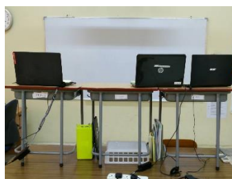
授業配信する教室風景