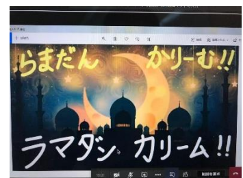
オンラインラマダン集会